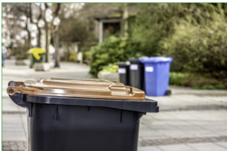
Zum 1. April 2019 führt der Landkreis Berchtesgadener Land die Biomülltonne ein. Zu erkennen ist diese an ihrem braunen Deckel.

Landrat Georg Grabner betont: „Unser Ziel ist es, die Entsorgung zu verbessern – für Bürger und Umwelt. Im Vordergrund steht in erster Linie die Abfallvermeidung: Wir möchten die Restabfallmenge bis 2030 um 30 Prozent reduzieren und für alle Landkreisbürger eine gebühren- und bedarfsgerechte Entsorgung mit modernem Service anbieten.“